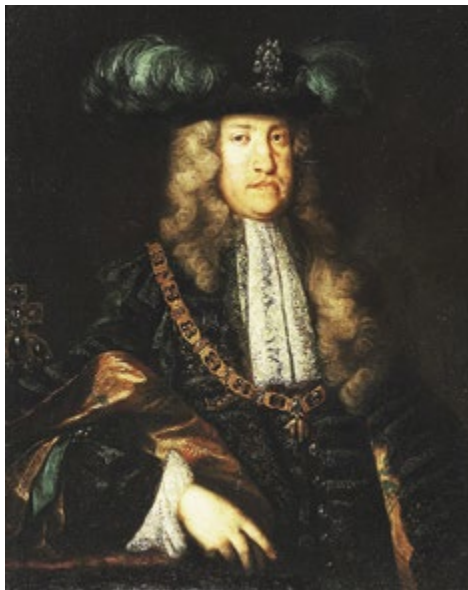
Портрет императора Священной Римской империи Карла VI. Худ. Мартин ван Майтенс. XVIII век

– Думаю, потому, что, как это ни жестоко прозвучит, смерть царевича давала стопроцентную гарантию того, что он больше не предъявит претензий на трон. Остальные варианты такой гарантии не давали. Как говорили в то время, «клобук не гвоздем к голове прибит».