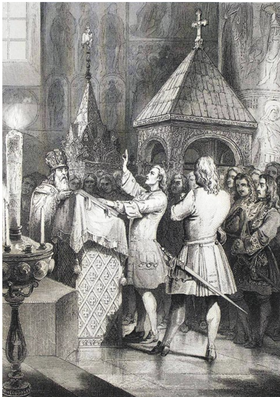
Отречение царевича Алексея Петровича от наследования престола в пользу своего сводного брата Петра Петровича в феврале 1718 года. Гравюра XIX века

Впрочем, история всей послепетровской России, в том числе и так называемой «эпохи дворцовых переворотов», показывает, что реформы Петра оказались необратимыми. Пути назад уже не было. Можно было что-то скорректировать, можно было что-то немного подправить, но в целом вернуть все к исходной точке уже не представлялось возможным. Хотя долгое время – целых полтора столетия – господствовало мнение,