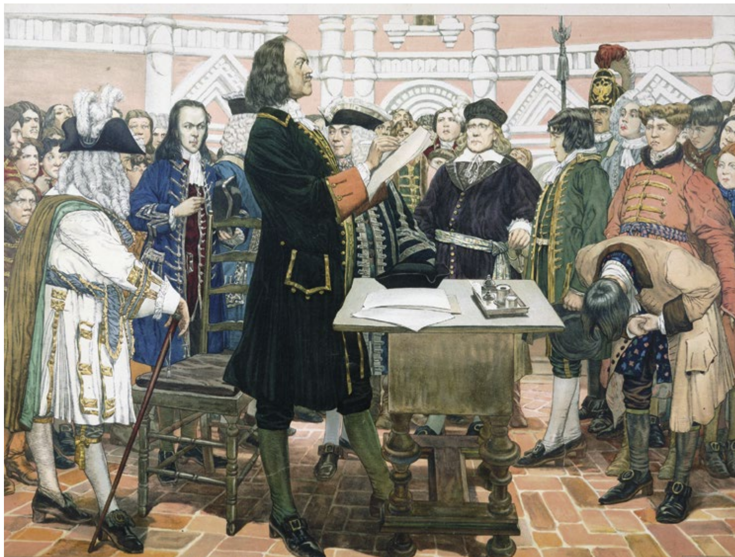
Смотр новиков. Худ. Д.Н. Кардовский. 1909 год

ных слоев, отодвигая «старую московскую аристократию» от власти. Эта точка зрения давно пересмотрена современной наукой: если мы посмотрим на политическую элиту Петровской эпохи, на тех, кто окружал царя-реформатора, то увидим, что среди них было немало представителей древних родов, входивших и в состав политической элиты XVII века. При этом мы не сможем привести примеров, когда Петр Великий целенаправленно боролся со старой аристократией.