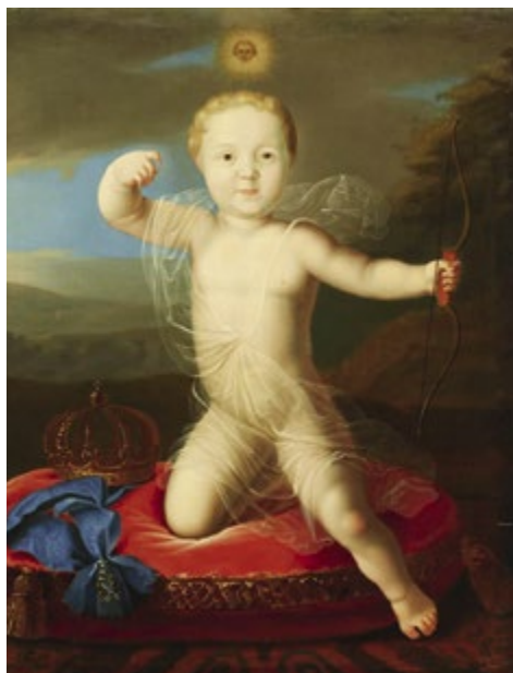
Портрет младенца царевича Петра Петровича в виде купидона. Неизвестный художник. Копия XIX века с портрета работы Луи Каравака

или по-прежнему будет манкировать своими обязанностями? Во втором случае, как недвусмысленно давал понять Петр, он расположен лишить Алексея права наследовать ему: «Лучше будь чужой добрый, неже свой непотребный». Уже тогда царевич отвечал, что готов отречься. «...Ослабел и непотребен стал к толкового народа правлению, где требует человека не такого гнилого, как я» – это его слова. Вскоре Петр опасно заболел, и, как только угроза жизни миновала, он вновь обратился с «объявлением» к старшему сыну, предложив ему на выбор либо активное участие в государственных делах, либо пострижение в монахи. «...Или отмени свой нрав и нелицемерно удостоить себя наследником, или будь монах: ибо без сего дух мой спокоен быть не может, а особливо что ныне мало здоров стал», – писал царь. Алексей согласился стать монахом.