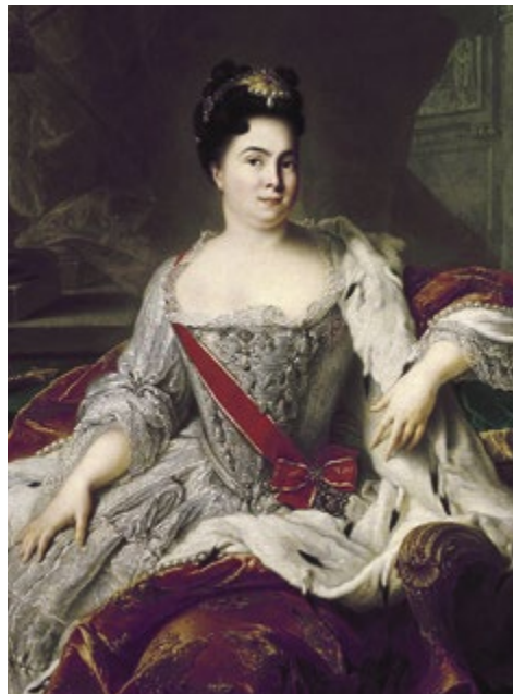
Портрет императрицы Екатерины I. Худ. Жан-Марк Натье. 1717 год

Не случайно в том же октябре 1715 года Петр Великий впервые в письме к старшему сыну настаивал на том, что Алексею пора определиться: готов ли он («весьма на правление дел государственных непотребный», как охарактеризовал его отец) начать служить отечеству