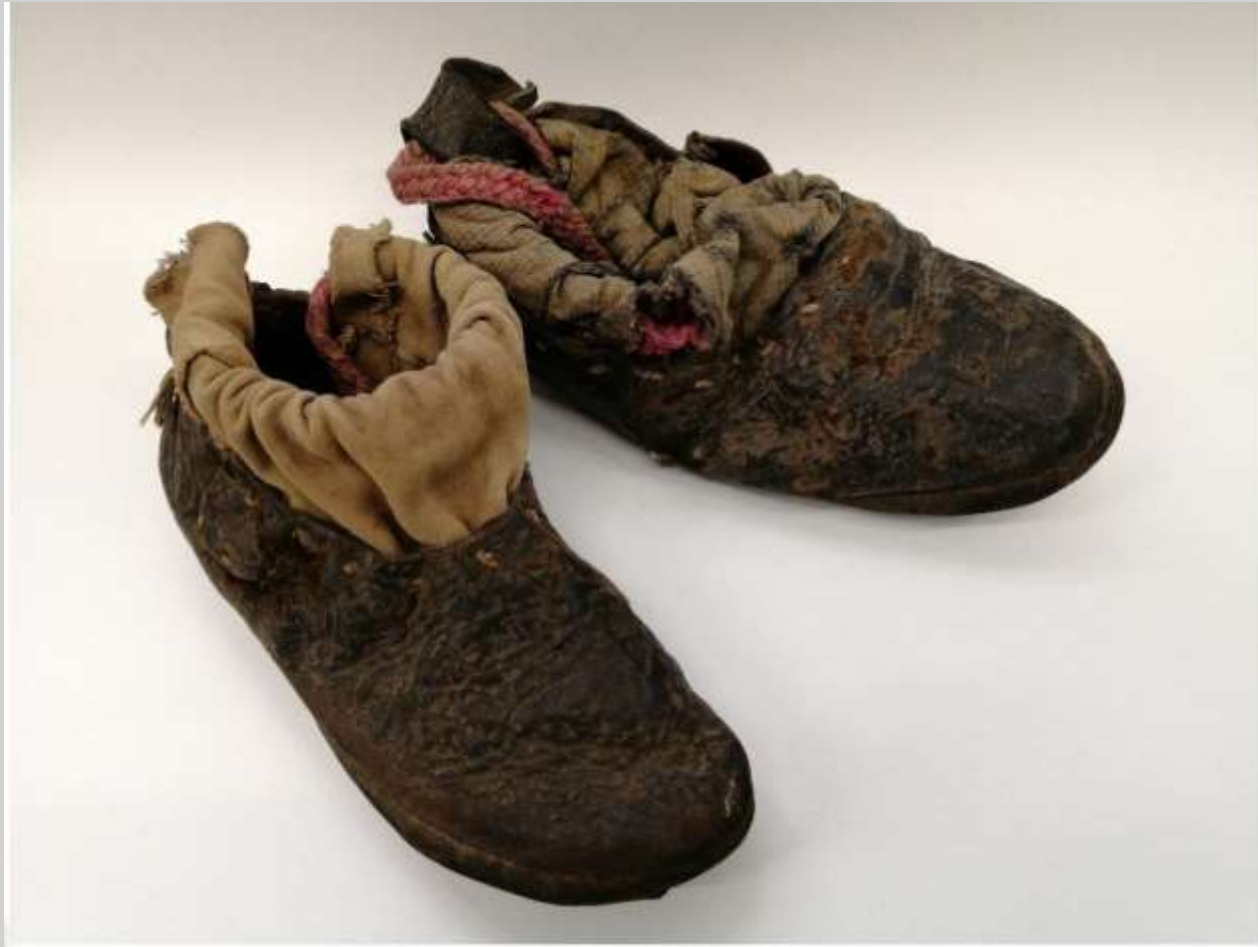
Коты, нач. XX века